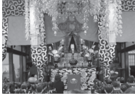
ひかり幼稚園卒園式

三月十八日(水)、令和七年度の卒園式が行われた。子どもたちを笑顔で送りだし、ののさまのやさしい気持ちも伝わってくる卒園式でした。