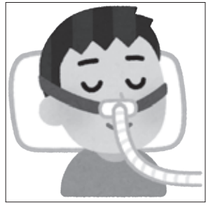
【図3】 CPAP は中等～重症の標準的治療である。

なく、睡眠を削って体調を崩すこともなく坐禅に臨みなさい」という意味です。筆者は「睡眠環境」という意味に変えています。仰向け寝は舌根やノドの壁が空気の通り道を塞ぎやすくするので、避けることが肝要です。右下、左下は問いませんが、釈尊に倣った横寝(側臥位)が良いのです。【図1】 また、効果が臨床研究によって証明されていますが、本誌令和6年6月号で紹介した「あいうべ体操」も、ノド・顎・舌・口の筋肉を鍛え、「調身」となって睡眠時無呼吸に良い影響を与える可能性があります。【図2】 (7) 逆に睡眠時無呼吸は筋肉が弛緩するタイプの睡眠薬で悪化します。不眠症で薬が効かずに悩んでいる方は、隠れた無呼吸に要注意です。