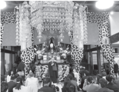
ひかり幼稚園入園式