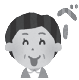
【図2】 あいうべ体操の「べー」は舌を前に出す筋肉を強化する。

【④調息 ⑤調心】 呼吸を調べ、調った心になる 睡眠時無呼吸の治療目標は、睡眠中の無呼吸による酸素欠乏と二酸化炭素の蓄積が起らないようにして、身体的ストレスを和らげ、自律神経や心臓をしっかり休ませて睡眠の質を向上させることにあります。調息によって調心が実現すると、昼間の強い